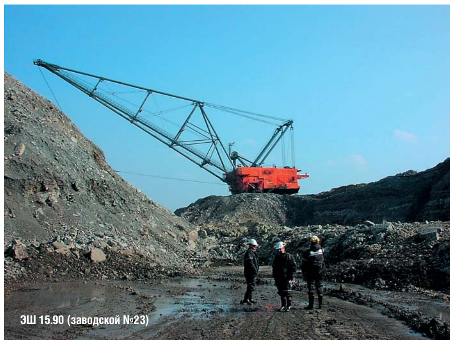
ЭШ 15.90 (заводской №23)

В настоящее время на практике была показана целесообразность применения АСС на землеройной и