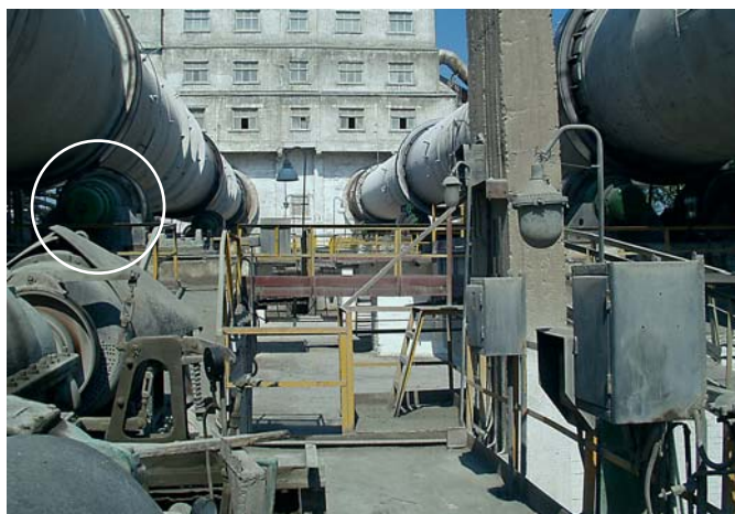
Опорный подшипник клинкерной печи

Постоянное поступление смазки во время движения состава позволяет ребордами колёс переносить смазку на закругления рельсов и тем самым снизить момент трения в трущейся паре колесо-рельс. Опыт применения смазочного оборудования для смазки пар трения колесо-рельс позволяет утверждать, что долговечность пары трения колесо-рельс в некоторых случаях увеличивается в два раза.