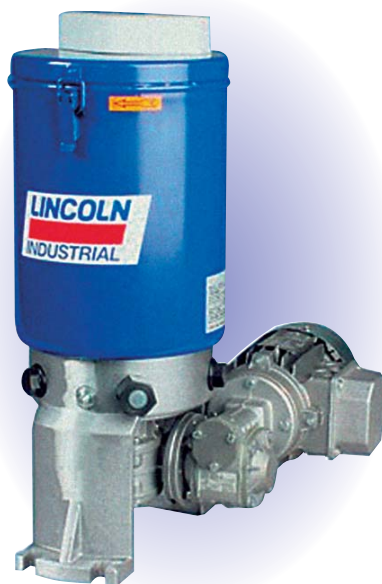
Насосная станция P 205

Никто сегодня не отрицает, что смазывать трущиеся пары во время работы намного эффективнее, чем во время остановки. Это касается как импортной техники фирм Caterpillar, Komatsu, Demag и др., так и продукции российских производителей тяжёлой карьерной техники (ОМЗ «Горное оборудование и Технологии», «Крастьямаш», РУПП «БЕЛАЗ» и т.д.). Но если в настоящее время почти 40–45% карьерных самосвалов уже работают в карьерах с ЦСС, то, к сожалению, этого пока нельзя сказать в отношении карьерных экскаваторов. Подобное положение, прежде всего, связано с тем, что элементы централизованной системы смазки экскаватора в значительной степени, как по металлоёмкости так и по сложности, отличаются от ЦСС карьерного самосвала. Однако компанией Lincoln GmbH & Co. KG уже разработаны централизованные системы смазки для всех экскаваторов российских производителей, которые могут быть закуплены через наших дилеров, а через