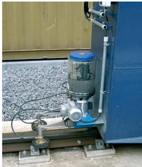
Смазка крановых путей

Немаловажным является вопрос смазывания опорных подшипников клинкерных печей. Из-за высокой температуры на подшипниках, там где применяется закладная густая смазка, зачастую долговечность подшипников очень ограничена. Причина выхода подшипников из строя заключается прежде всего в том, что при высокой температуре применяемая густая смазка превращается в жидкость, которая потеряла уже все свои свойства. Учитывая низкие окружные скорости печи эта «жидкая смазка», захваченная шарикоподшипником, не успевает дойти до его верхней части. В результате начинается трение металла по металлу, что приводит в дальнейшем к разрушению подшипника. Преждевременный выход из строя особенно часто наблюдается на подшипниках, расположенных наиболее близко к камере горения. Для увеличения продолжительности работы подшипников на клинкерных печах компания Lincoln предлагает очень простое решение, которое заключается в постоянной подаче малой дозы густой смазки в верхнюю часть подшипника. Причём марка смазки остаётся прежняя. Для этих целей предлагается на каждую опору устанавливать насосную станцию ти-