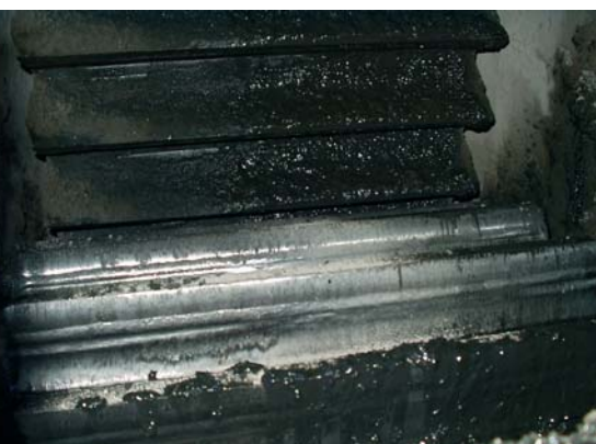
Открытая зубчатая передача мельницы